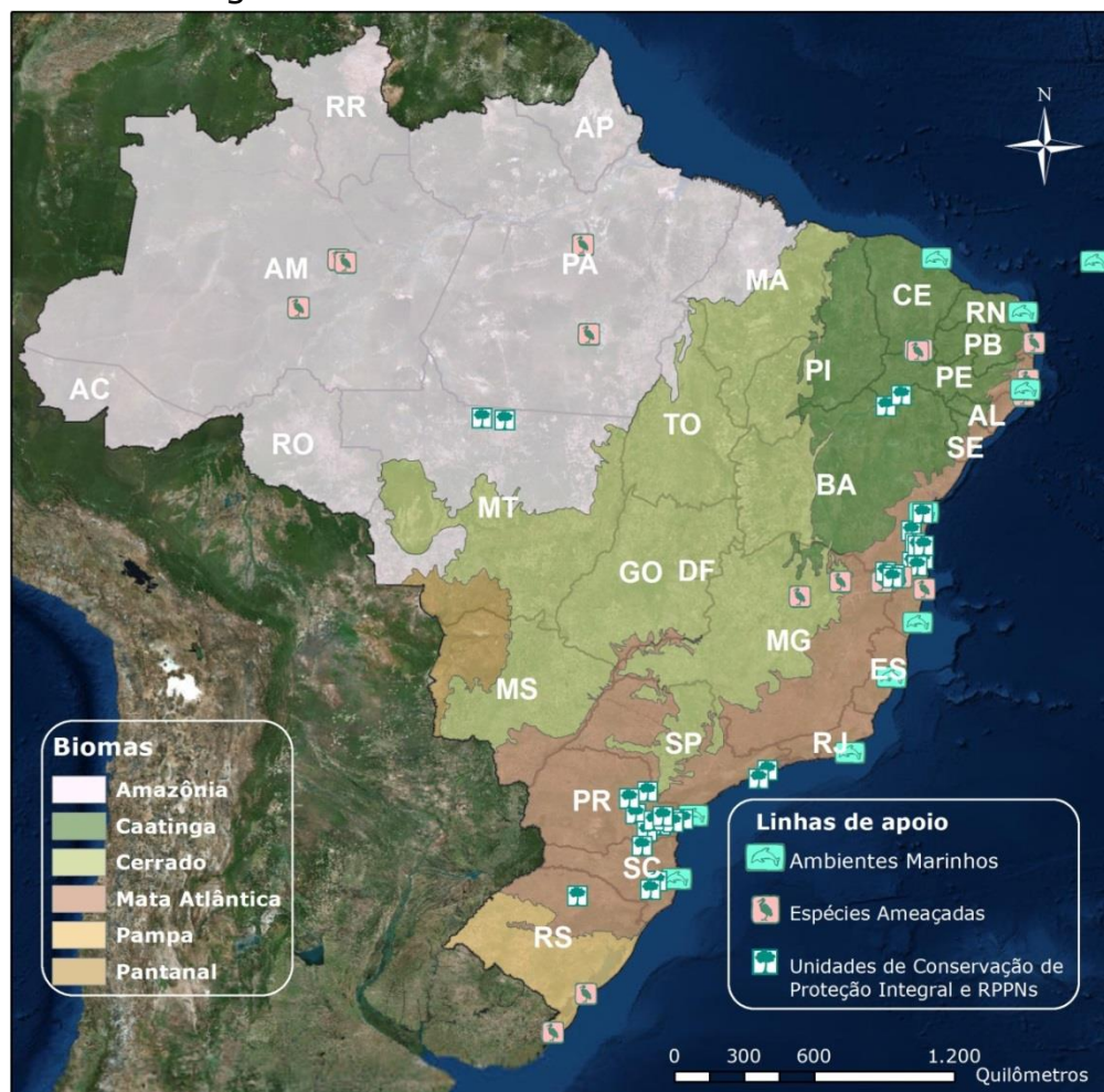
Figura 01 – Distribuição geográfica das iniciativas selecionadas no primeiro edital de 2015 do Apoio a Projetos da Fundação Grupo Boticário (algumas iniciativas possuem ações em mais de uma localidade)

O processo seletivo para o primeiro edital de Apoio a Projetos da Fundação Grupo Boticário de 2015, direcionado para todo o território nacional, resultou em 14 iniciativas selecionadas para receber apoio financeiro, totalizando um investimento de cerca de R$ 865 mil. A distribuição geográfica das iniciativas selecionadas é apresentada na figura 01 e são detalhadas na tabela 01.